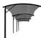
+ 2 extensiones